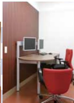
カウンセリングルーム