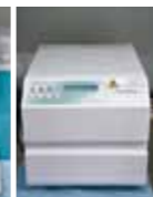
ステイティム（高圧蒸気滅菌器）