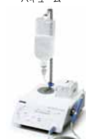
ピエソンマスターサージェリー（超音波振動外科手術器）