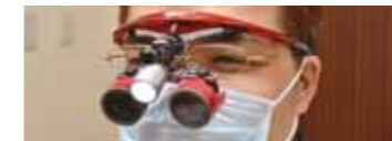
LED 照明付歯科用双眼ルーベ *全スタッフが所持しています。

※歯が欠けたり失われたりした場合に、かぶせ物、差し歯、ブリッジ、入れ歯（義歯）、インプラントなどの人工物で補い、機能・審美を回復することを専門とし、学会で認められた歯科医師です。 社団法人日本補綴歯科学会 http://www.hotetsu.com/p1.html