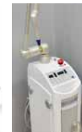
炭酸ガスレーザー