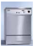
ミーレジェットウォッシャー（洗浄・消毒器）