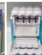
クアトロケア （自動注油洗浄器）