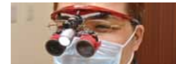
LED 照明付歯科用双眼ルーベ *全スタッフが所持しています。

※歯が欠けたり失われたりした場合に、かぶせ物、差し歯、ブリッジ、入れ歯（義歯）、インプラントなどの人工物で補い、機能・審美を回復することを専門とし、学会で認められた歯科医師です。 社団法人日本補綴歯科学会 http://www.hotetsu.com/p1.html