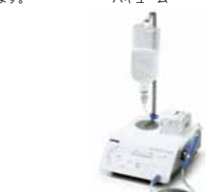
ピエゾン マスターサージェリー （超音波振動外科手術器）