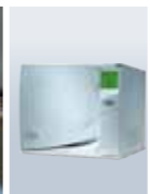
ミーレ ジェットウォッシャー （洗浄・消毒器）