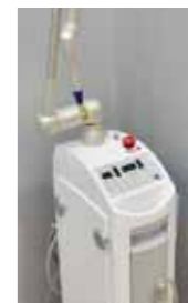
炭酸ガスレーザー