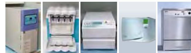
ホルホープ (ガス滅菌器) クアトロケア (自動注油洗浄器) スティティム (高圧蒸気滅菌器) Lisa (高圧蒸気滅菌器) ミーレジェットウォッシャー (洗浄・消毒器)

使用器材の衛生管理のため、洗浄・消毒に関する国際規格 (ISO15883) に基づいた高度な洗浄・消毒や、高い安全性を追求した滅菌システムを採用しています。