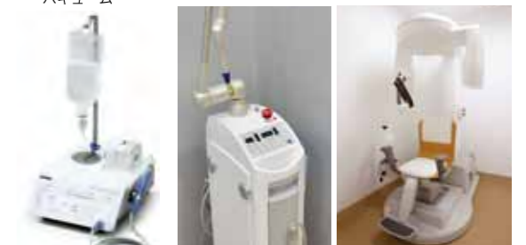
ピエソン マスターサージェリー (超音波振動外科手術器)