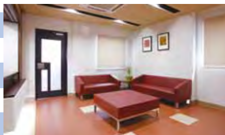
ロビー カウンセリングルーム