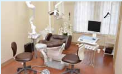
当クリニック： 診療室A(個室)

これに対して診療室が個室の医院では見通しが悪いいため、各々の部屋の治療の状況が確認しにくく、効率よく患者さんを診ていくことが困難です。小料理屋さんなどと同じで、効率よりも重要視していることがあるからです。では、何を重視して個室にするのでしょうか?