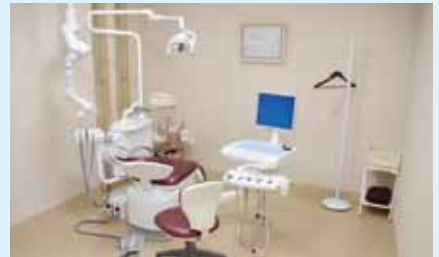
当クリニック： 診療室B(個室)

歯科で行われる治療の多くは、程度の差はありますが外科手術です。出血を伴う処置を行うわけですので、当然、個室(簡易手術室)の方がより安全に治療を行うことができます。