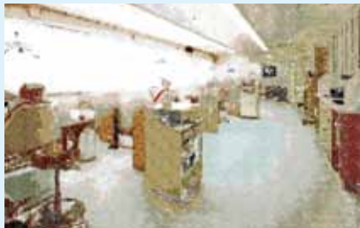
一般的なオープンスペースの歯科

一般的な歯科医院では、オープンスペースで見通しが良く、院内の状況が一目でわかりやすいようにチェア(診療台)が配置されています。同じ時間内であれば個室より多くの患者さんを診ていくことができるためです。ファミレスなどのファストフードの店でも同じような作りをしているのでわかりやすいかと思います。